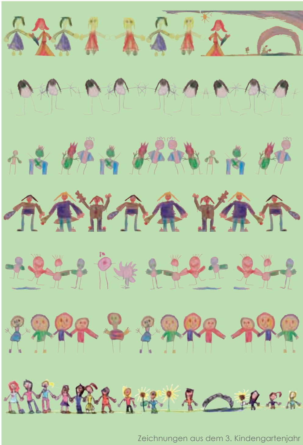
Zeichnungen aus dem 3. Kindergartenjahr