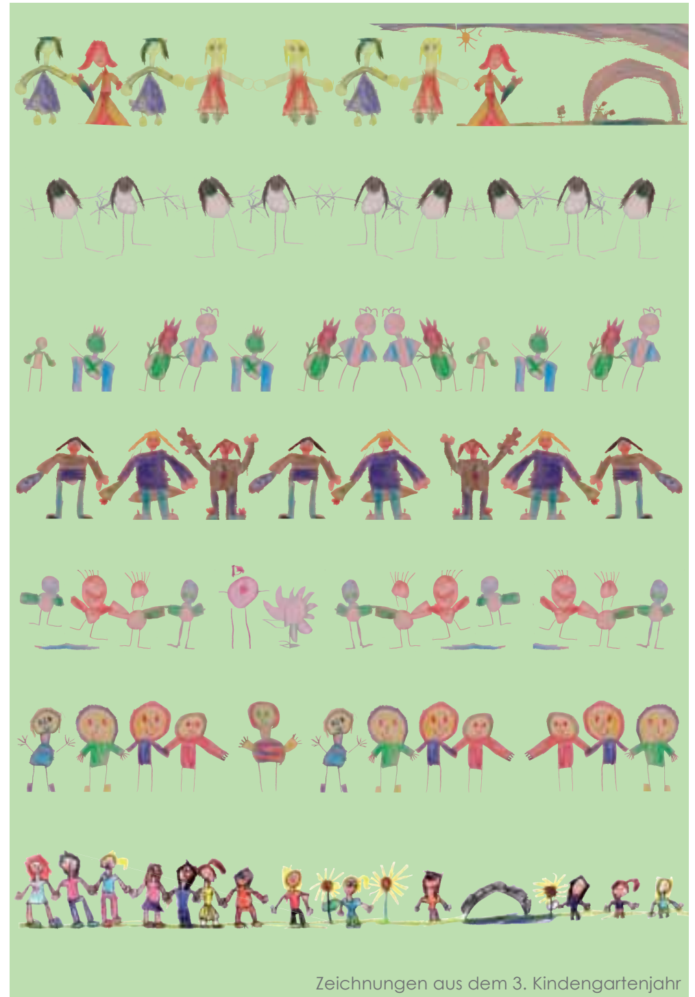
Zeichnungen aus dem 3. Kindergartenjahr